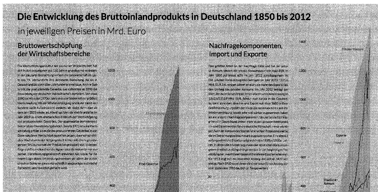
Abb. 3: Prototyp-Seiten des vademecums

Es ist daher mehr als naheliegend, aus den mittlerweile über 250.000 in histat enthaltenen Zeitreihen sowie in Fortführung der überholten Publikation des Statistischen Bundesamtes ein vademecum zu erstellen, das für die Wissenschaft, die Politik sowie die Medien eine kompakte und verlässliche Übersicht mit den „1.000 wichtigsten“ Reihen verfügbar macht. Geplant ist eine „kombinierte Hybrid-Edition“: Neben einer Print-Publikation, die ausgewählte Jahre tabellarisch aufführt (25 % des Gesamtumfangs), die wichtigsten Entwicklungen allgemeinverständlich erläutert (50 % des Gesamtumfangs) sowie grafisch abbildet (25 % des Gesamtumfangs), werden die Zeitreihen auf Jahresbasis und wissenschaftlich dokumentiert in der histat-Datenbank als